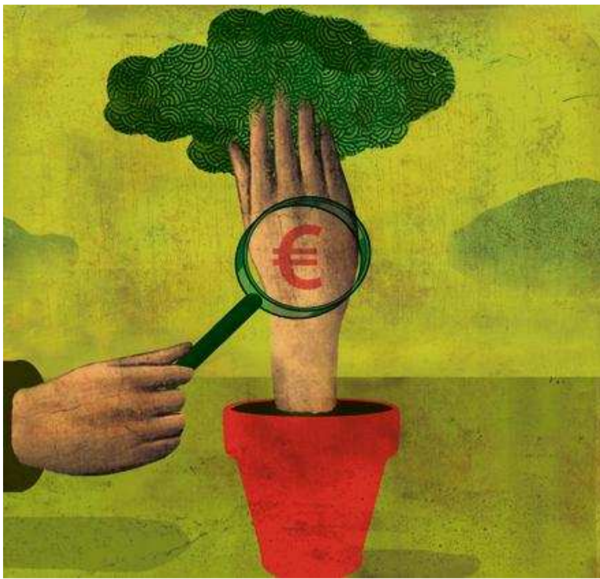
ILLUSTRATION OLIVIER MARBCEUF

Ces dernières années, les gérants de ces produits ont cependant essayé d'élargir leur horizon d'investissement à des structures plus modestes, moins « liquides ». On compte ainsi une douzaine d'investissements solidaires différents dans le fonds de capital risque Mandarine Capital Solidaire et deux douzaines dans le fonds Natixis Solidaire de Mirova, leader du