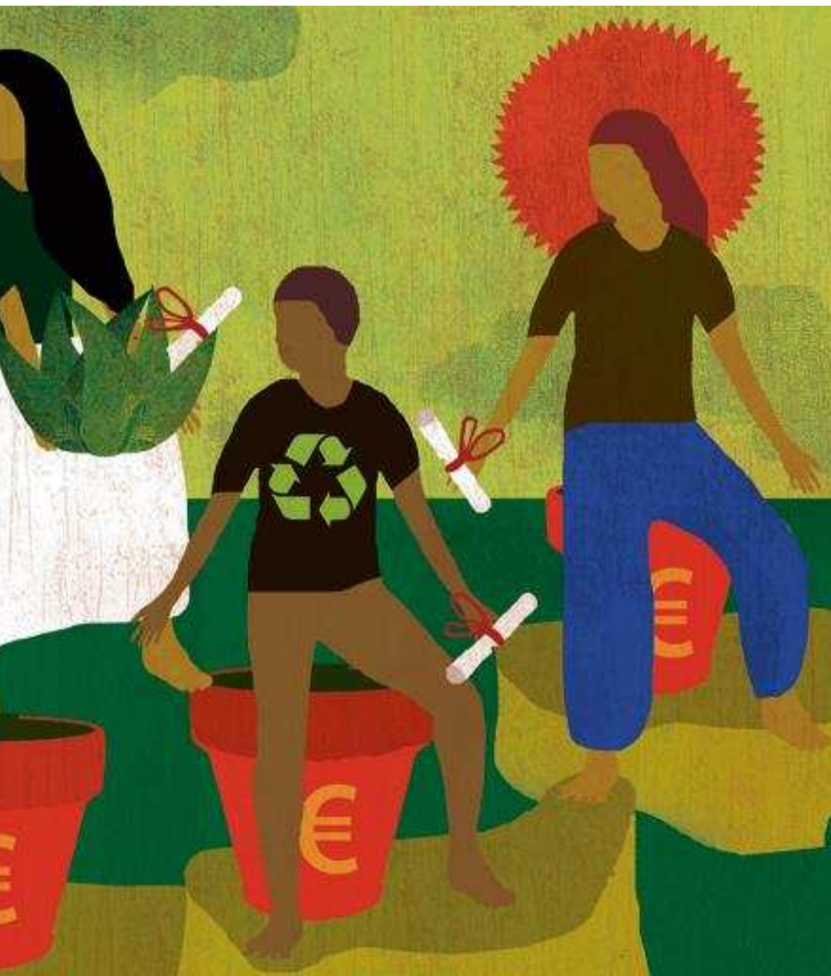
ILLUSTRATION OLIVIER MARBEUF